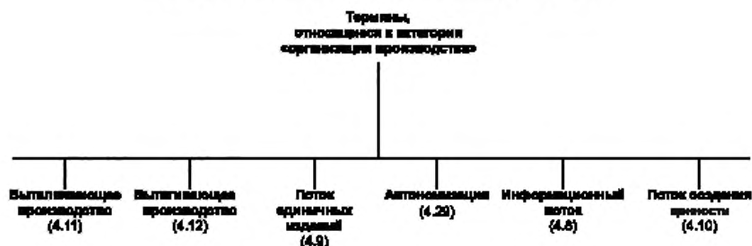
Рисунок А.1 — Термины, относящиеся к категории «организация производства»