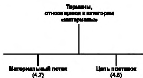
Рисунок А.3 — Термины, относящиеся к категории «материалы»